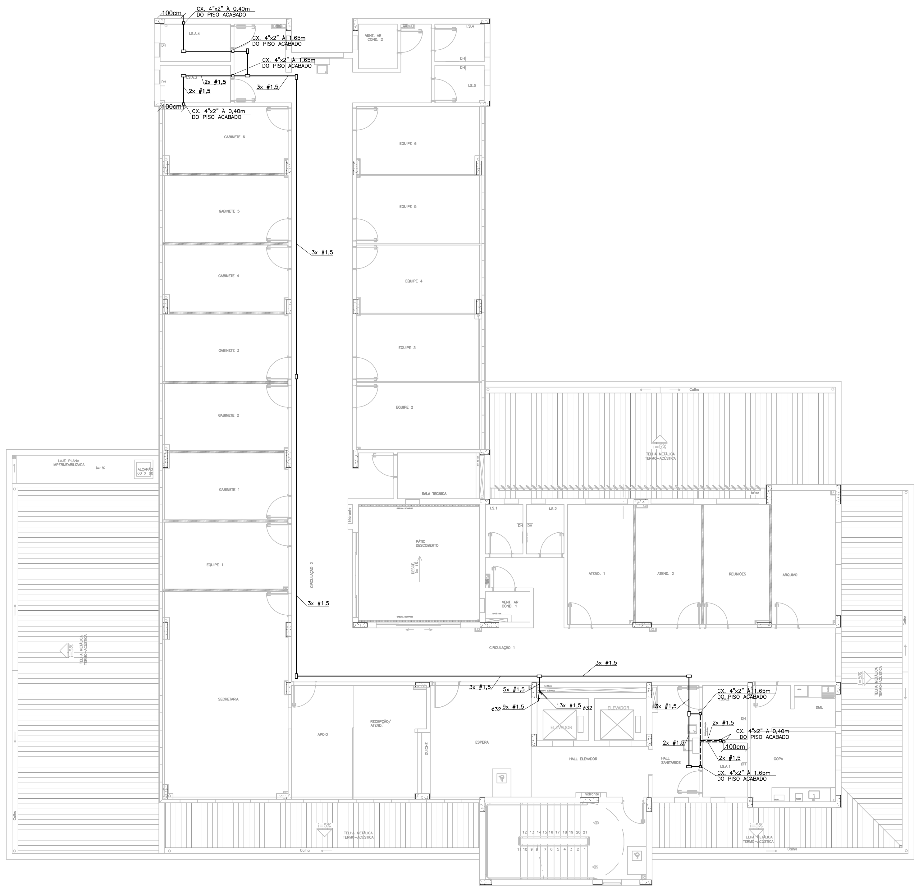
3º PAVIMENTO ESCALA 1/100